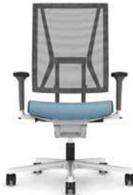
300.5000 + al301