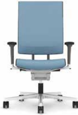
300.1000 + al301