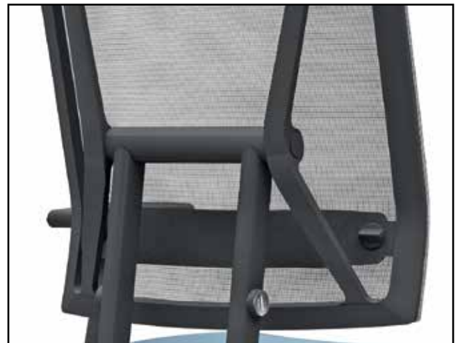
Lordosenverstellung / Lumbar adjustment / Ajustement du soutien lombaire / Lumbaalverstelling