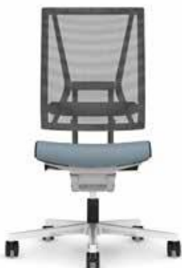
300.5000 + ls300