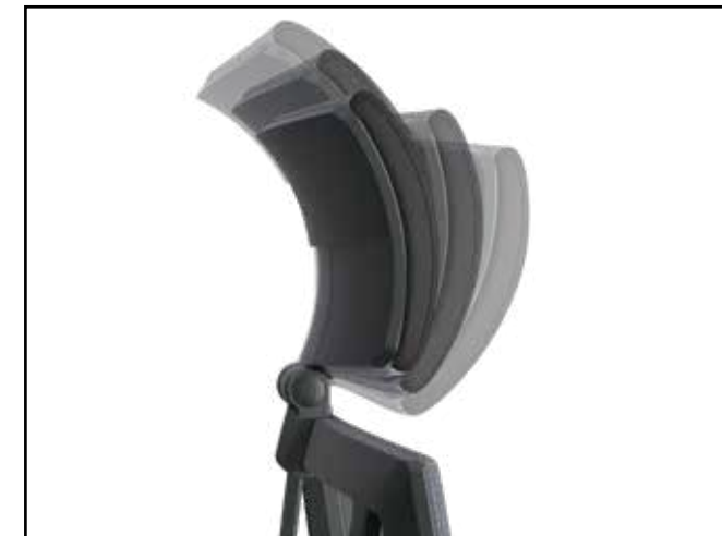
Flexible Kopfstütze / Flexible headrest / Tête flexible / Flexibel hoofdsteen