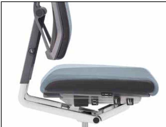
Sitzneigung, -höhe, -tiefe / Seat tilt, height, depth / Inclinaison, hauteur, profondeur de l'assise / Zit-neigverstelling

Task chair with integrated functions / Siège de travail avec fonctions intégrées / Bureaustoel met geïntegreerde functies