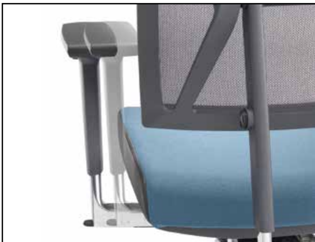
Armlehnenbreite / Armrest width / Largeur des accoudoirs / Breedteverstelling armleuning