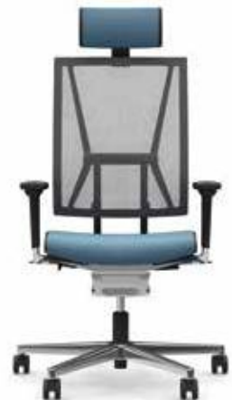
300.5000 + al301 + ns302