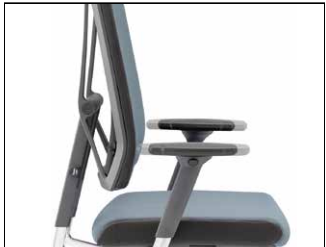
Armlehntiefe / Armrest depth / Profondeur des manchettes d'accoudoirs / Diepteverstelling armleuning