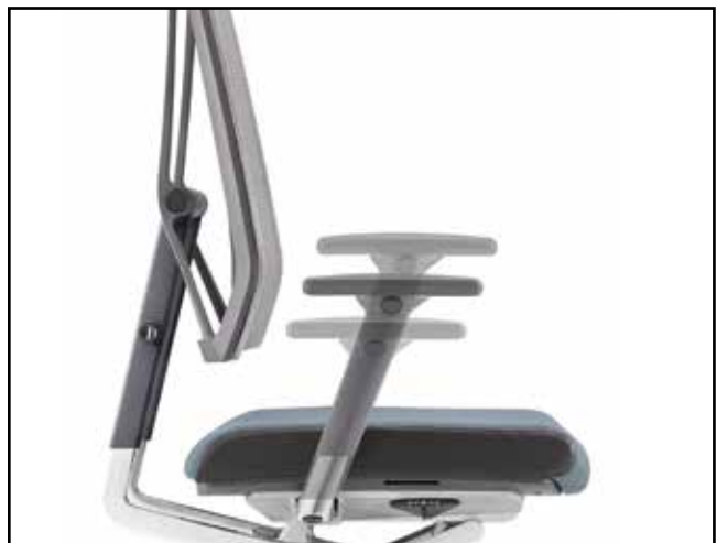
Armlehnenhöhe / Armrest height / Hauteur des accoudoirs / Hoogteverstelling armleuning