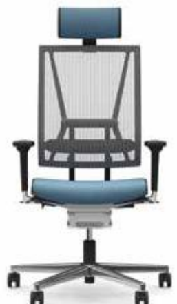
300.5000 + al301 + ls300 + ns302