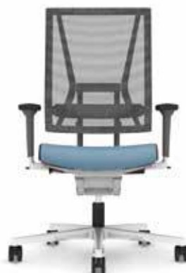
300.5000 + al301 + ls300