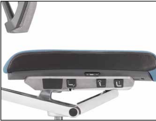
Übersichtliche Bedienelemente / Well arranged user controls / Fonctions faciles d'accès et rapidement repérables / Overzichtelijke bedieningselementen