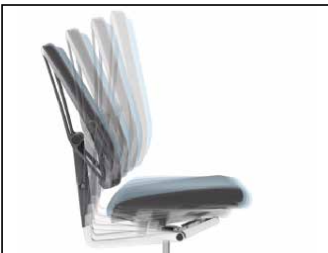
Synchronmechanik / Synchronous mechanics / Mécanisme synchrone / Synchroonmechaniek