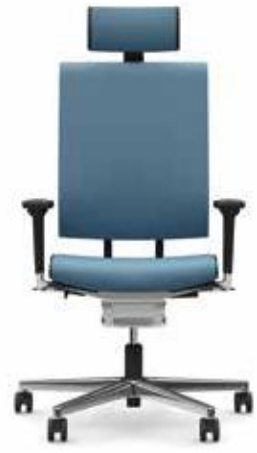
300.1000 + al301 + ns302