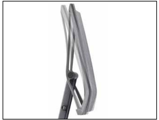
Flexible Rückenlehne mit Arretierung der Neigung / Flexible backrest with backrest tilt / Dossier flexible avec effet anti-retour / Flexibele rugleuning met blokkering