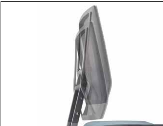
Rückenlehnenhöhe / Backrest height / Hauteur du dossier / Hoogteverstelling rugleuning